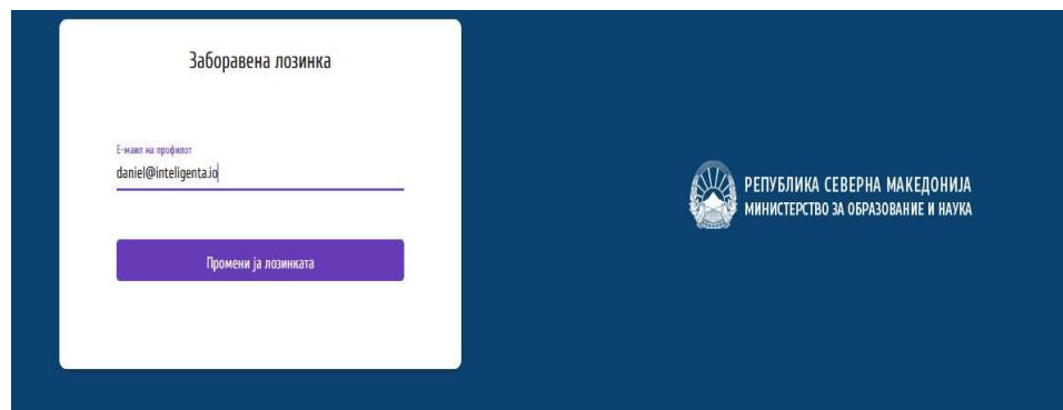
Слика 2 – ресетирање на заборавена лозинка